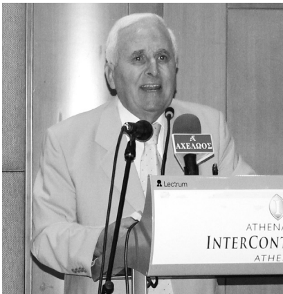
Ό Πρόεδρος της ΑΣΠΕ και της ΕΠΑ κ. Βασίλειος Θεοτοκάτος