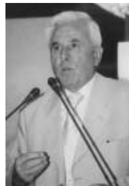
Ο Πρόεδρος της Α.Σ.Π.Ε. και της Ε.Π.Α. κ. Βάσ. Θεοτοκάτος άπευθύνει χαιρετισμό.

Ο Πρόεδρος της Α.Σ.Π.Ε. και της Ε.Π.Α. κ. Βασίλειος Θεοτοκάτος με τό χαιρετισμό που άπνυθνε, ευχόθηκε στα «πρωτάκια» να έχουν πάντα επιτυχίες στο Σχολείο και στο στίβο της μάθησης, ενώ για μία ακόμα φορά επισήμανε τα μέτρα που υποχρεούται να λάβει η πολιτεία για την ανάκαμψη της υπογεννητικότητας.