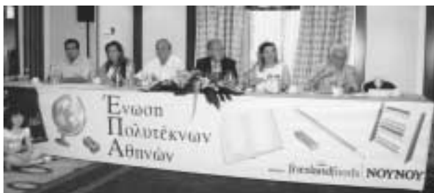
Μέλη του Δ.Σ. της Ε.Π.Α. και η εκπρόσωπος της Frisland Foods NOYNOY

Η γιορτή, όπως κάθε χρόνο, είχε εορταστικό χαρακτήρα με παιδική μουσική, κλήδον και παιδική παράσταση Καραγκιόζη.