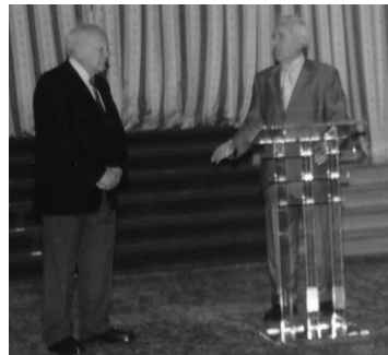
Ὁ Πρόεδρος τῆς Δημοκρατίας καί ὁ Πρόεδρος τῆς Α.Σ.Π.Ε.