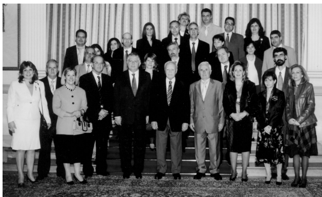
Ἀντιπροσωπεία πολυτέκνων στό Προεδρικό Μέγαρο.

β. Ὁ Πρόεδρος τῆς Δημοκρατίας κ. Κάρολος Παπούλιας ὑποδέχτηκε τήν Τρίτη 4 Νοεμβρίου 2008 στό Προεδρικό Μέγαρο ἀντιπροσωπεία τῆς Ε.Ε. τῆς Α.Σ.Π.Ε. καί τοῦ Δ.Σ. τῆς Ε.Π.Α., καθώς καί δέκα πολύτεκνα ζευγάρια, ἐπιστήμονες, μέ πέντε παιδιά καί ἄνω, συνοδευόμενα ἀπό τόν Ὑφυπουργό Ὑγείας καί Κοινωνικῆς Ἀλληλεγγύης κ. Γεώργιο Κωνσταντόπουλο .