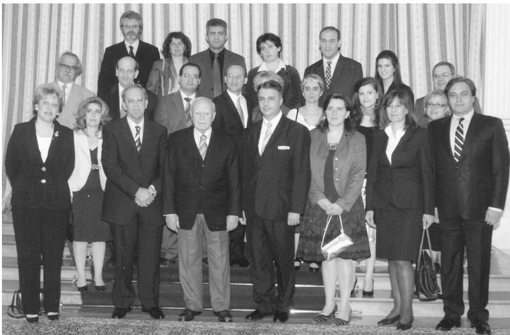
Αντιπροσωπεία του Προεδρείου της Α.Σ.Π.Ε. και πολύτεκνες οικογένειες με τον Πρόεδρο της Δημοκρατίας.