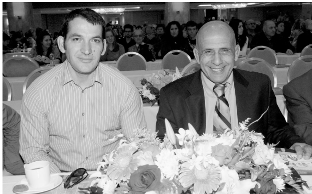
Οἱ βραβευθέντες Ὀλυμπιονίκες Πύρρος Δήμας (ἀριστερά) καὶ Πέτρος Γαλακτόπουλος.

Στὴν ἐκδήλωση τιμήθηκαν οἱ Ὀλυμπιονίκες Πύρρος Δήμας καὶ Πέτρος Γαλακτόπουλος ὡς «πρωταθλητὲς του ἥθους, του στίβου καὶ τῆς ζωῆς πού δόξασαν τὴν Ἑλλάδα παγκοσμίως».